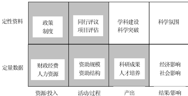
图3 科学基金绩效报告的分析框架

其次,绩效报告主要以活动和过程信息为主,缺少明确的产出和结果指标(如图3所示)。报告的主要内容是投入、过程和产出方面的绩效指标,几乎没有结果指标。我们通过报告可以明确 JSPS 投入了哪些资源,制定了哪些制度并开展了哪些活动,资助了多少项目,培养了多少人,但却无法知道这些资助活动对于学科建设和科学进步意味着什么,它是否有助于量化的科学氛围的形成,乃至对经济社会发展产生实质性的影响。